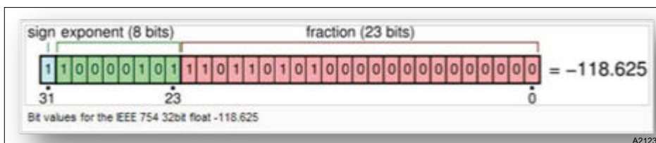
Fig. 2 : Exemple pour un registre virgule flottante 32 bits IEEE

L'interface Modbus diaLog ProMinent utilise le format IEEE 754 pour les valeurs à virgule flottante 32 bits (avec simple précision).